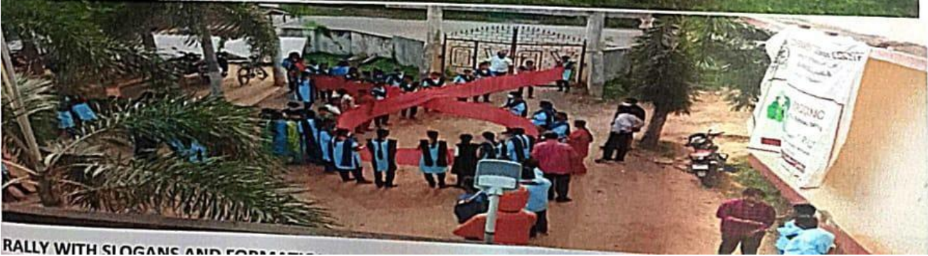
RALLY WITH SLOGANS AND FORMATIONS